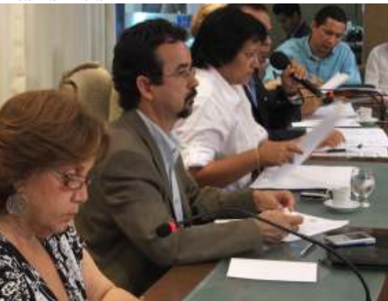
Autoridades discutem piso salarial da educação